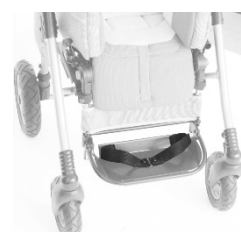
Sangles fixations des pieds