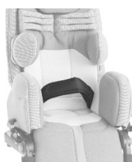
Ceinture de bassin