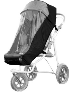
Housse anti pluie ( que en combinaison avec pare-soleil)