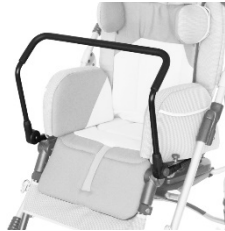
Barre de préhension