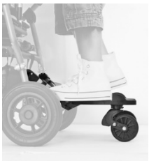
Planche de poussette