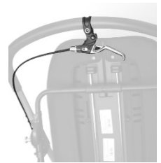
Frein à main