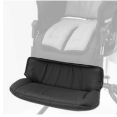
Sprotection rembourées pour repose pied