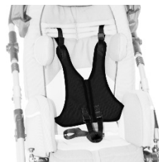
Harnais de fixation 5 points