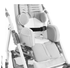
Sangle de poitrine