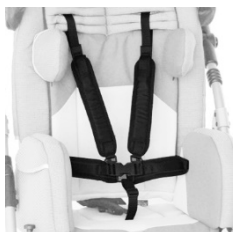
Ceinture à cinq points 'luxe'