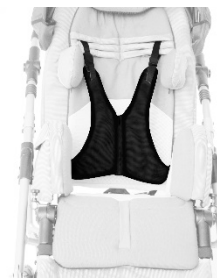
Harnais de fixation